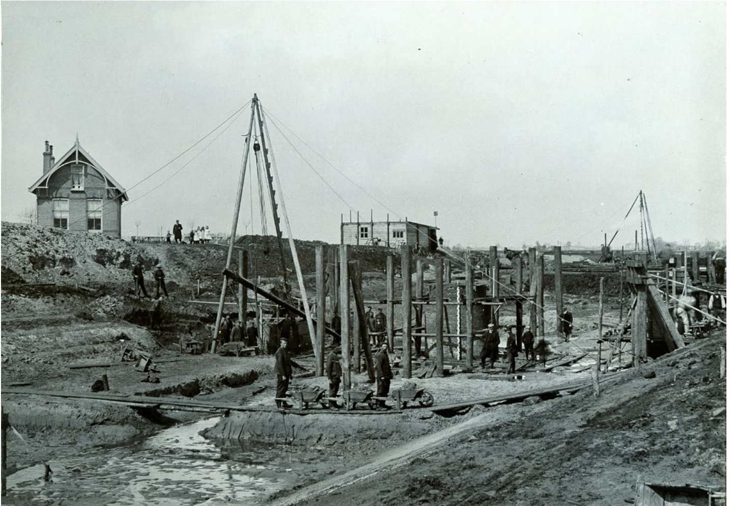
Voorbeeld van een dienstwoning: brugwachterswoning in aanbouw bij Wijmeersterbrug, 1909. Waterschap Hunze en Aa's, archief waterschap Westerwolde, inv.nr. 2351 (Op: www.beeldbankgroningen.nl ).

Daar presenteren onder meer gemeentearchieven, waterschappen, musea en verenigingen hun historische foto's en kaarten. Wij raden u aan om ruim te zoeken. Zoeken op bijvoorbeeld een straatnaam, levert niet alle gewenste foto's op.