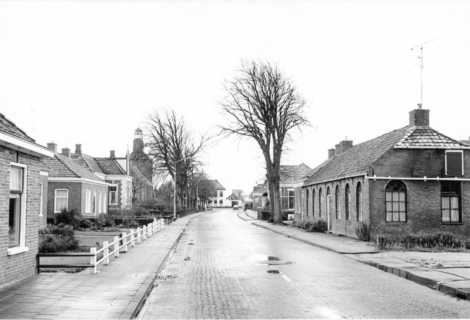
Tammingastraat in Hornhuizen, 1972.

Zo doet u onderzoek naar uw eigen huis of een ander gebouw