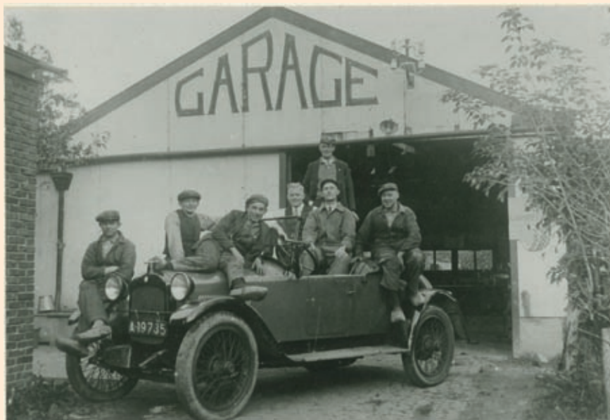
Garage Gebr. Hes, Niekerk, ca. 1930

Zie hoofdstuk 9. De jaren 1812-1813 zijn niet bewaard gebleven.