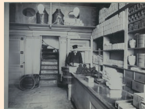
Tabakswinkel De Rookende Moor, Oude Ebbingestraat 46, Groningen, 1908